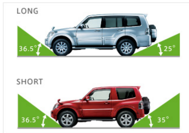
イラストは、SUPER EXCEED(LONG) / VR-II(SHORT)