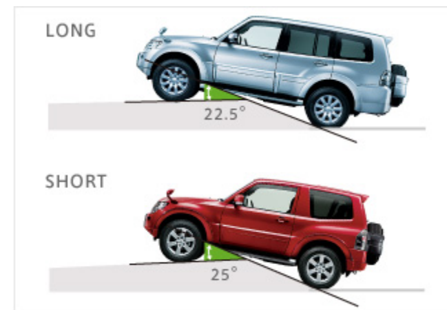
イラストは、SUPER EXCEED(LONG) / VR-II(SHORT)

低速走行時に、大きな突起を乗り越える際や、起伏の大きい路面を走行中に、ボディの底つきや乗り上げを防止。オフロードでのすぐれた走破性をサポートします。