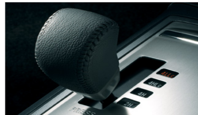
4WDトランスファーレバー

●トランスファーレバー操作、4WD走行に関して、さまざまな注意事項があります。詳しくは取扱説明書をご覧ください。