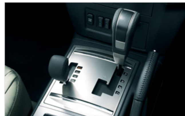
INVECS-II スポーツモード5速A/T (リヤデフロックはメーカーオプション)

INVECS=Intelligent &amp; Innovative Vehicle Electronic Control System