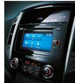
(ロング車専用: EXCEED に標準装備)