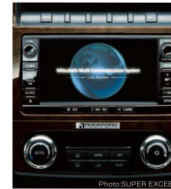
(ロング車専用: SUPER EXCEED に標準装備、EXCEED にメーカーオプション)